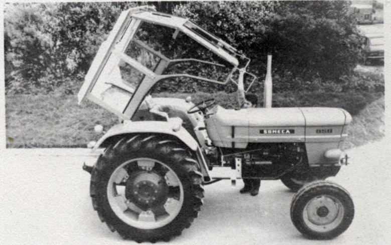
Basculement vers l'arrière