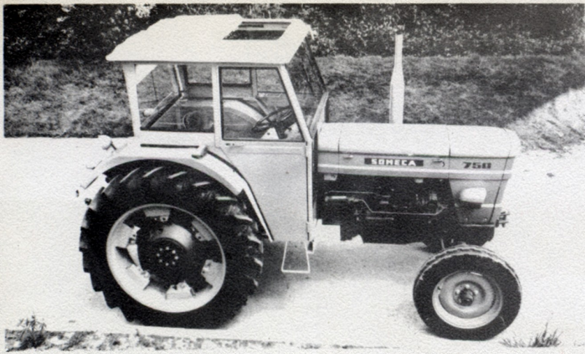
Toit ouvrant coulissant à l'aide de poignées intérieures (option).