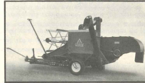
B.P. 180 avec plateforme d'ensilage, au travail derrière un SOM. 40

La période pendant laquelle le grain est susceptible d'être coupé dans de bonnes conditions de maturité et d'humidité étant de courte durée, les cultivateurs s'efforcent toujours d'accélérer le rendement horaire du travail.