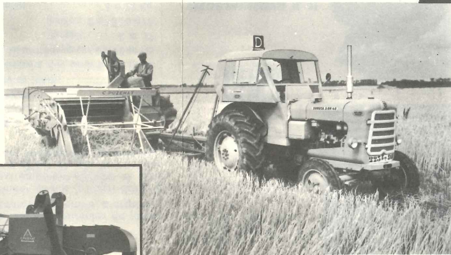
B.P. 180 avec trémie de 980 litres