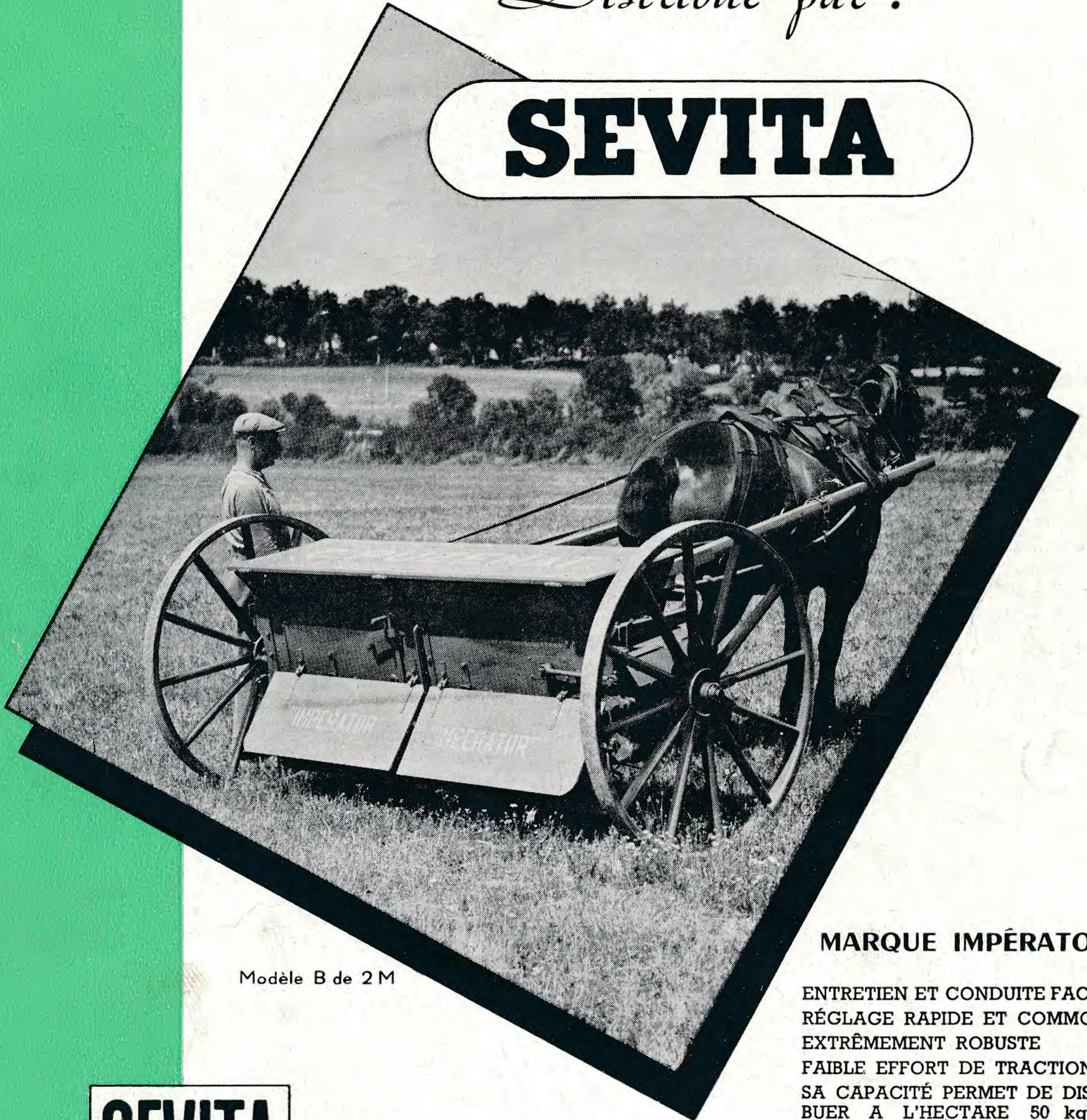
Modèle B de 2 M